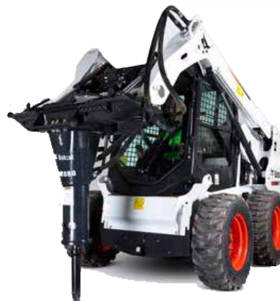
Bobcat 553 con martillo